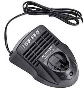
Bosch 10.8-12V Li-Ion