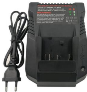
Bosch 18V Li-Ion