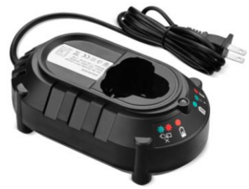
Bosch 12-18V Ni-Cd TS