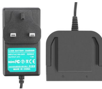
AEG 18V Li-Ion