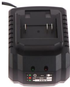
PAP 18-21 V Li-Ion