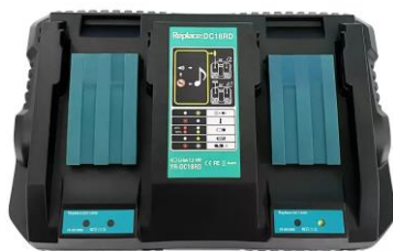
Makita DC18RC PRO