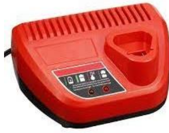
M12 10.8-12V XC