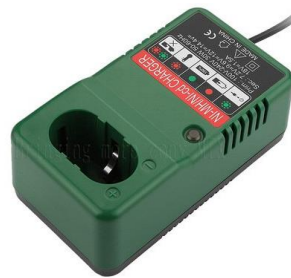
Makita 12-18V Ni-Cd TS