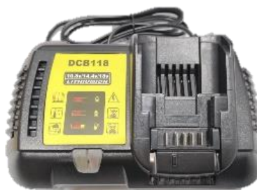
DEWALT 18V Li-Ion