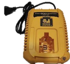
DEWALT 12-18V Ni-Cd