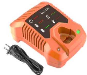
AEG 12V Li-Ion