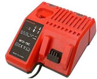
M12-18 10.8-18V XC