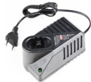
Bosch 12-18V Ni-Cd TS